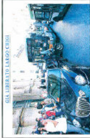
GIÀ LIBERATO LARGO CRIGI

Via Borgognona, Bocca di Leone, via Vittoria e via Condotti dedicate all'accoglienza. Tuscolana, Salaria, periferie tra mostre e vetrine A via Veneto il primo ciak della Festa Inaugurata dopo il restyling la strada della Dolce Vita. La rassegna entra nei quartieri